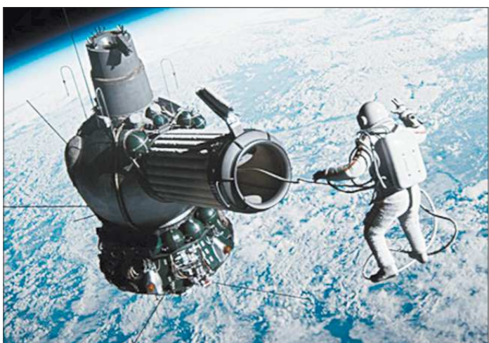
Кадр из фильма «Время первых». Рек. Дмитрий Киселев

Эта история произошла за 48 лет до того, как появился американский фильм «Гравитация». Да, создатели картины «Время первых» рьяно отрицаются от всех параллелей с голливудским предшественником, но общие черты у них точно есть.