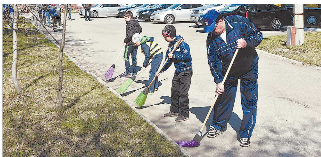
Создатели «Метлы» уверены, что помогать в уборке Екатеринбурга надо не только на субботниках

Главная задача проекта — помочь городским властям составить новую комплексную программу по борьбе с грязью и вести гражданский контроль уборки на городских улицах. Для этого в ряды сторонников комитета приглашают всех желающих — достаточно подписаться на группы «Метлы» в соц-