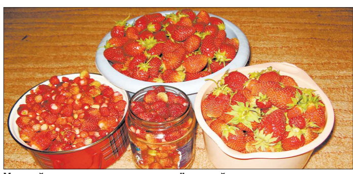
Урожай ягод закладывается ещё весной