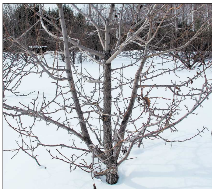
Чаще всего у деревьев поражается та часть, что граничит со снежным покровом. Именно там скапливался зимой самый холодный воздух