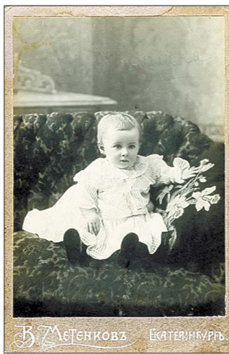
Салонная съёмка. Фотопроект маленькой девочки