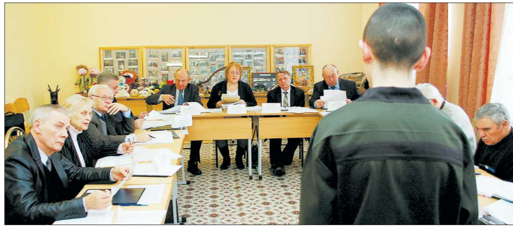
От дотошных членов комиссии по помилованию не ускользнёт ни одна деталь в ходатайствах к президенту