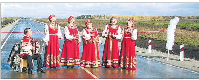
Открытие дороги в Кайгородском отметили выступлением песенного коллектива

В этом году дорога до села Серебрянка станет постоянной проезжей. На её строительство из областного резервного фонда выделено 250 миллионов рублей. На объекте уже работает техника. Серебрянцы надеются, что с пуском трассы у них начнётся новая жизнь.