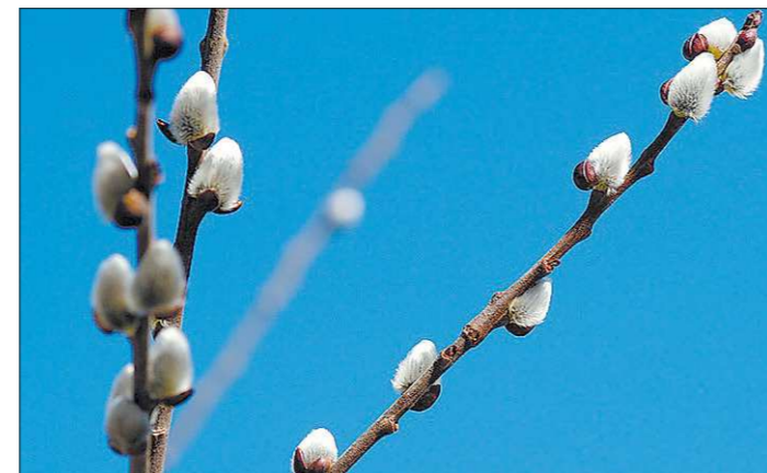
Верб — символ весны, возрождения, радости, божественного воскресения

Однако нельзя забывать и о другом. Сколько великих людей мира восторгаются нашей самоотверженностью, терпеливостью и трудолюбием. Мы первыми покорили космос, наша Белоярская атомная станция — пре-