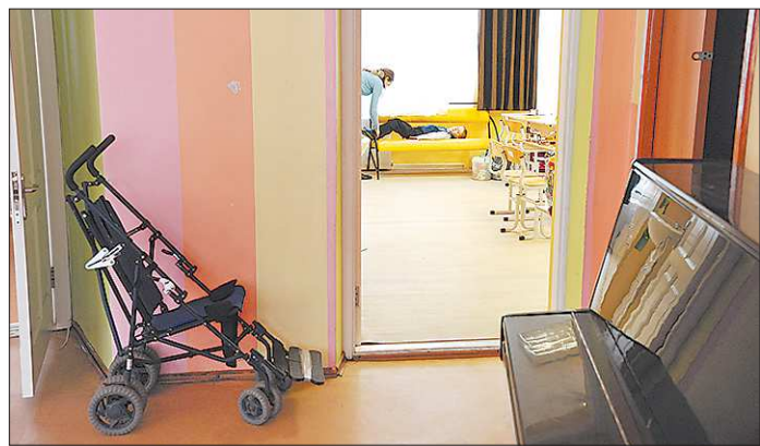
В России 8,2 миллиона человек, страдающих различными заболеваниями, нуждаются в услугах сиделок, и это без учёта пожилых людей