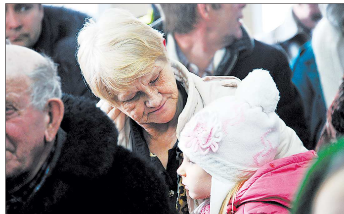
Бабушек, готовых нянчиться с чужими детьми, в регионах пока что больше, чем семей, готовых принять эту помощь

Проект «Бабушка на час» был запущен в 2012 году Байкальским благотворительным фондом при поддержке минсоцзащиты Бурятии. Пилотный проект прошёл отработку в Улан-Удэ, затем к нему присоединились в Ивановской и Нижегородской областях, в Орле и в других регионах. Активные пенсионеры порой совершенно бесплатно помогают семьям с детьми-инвалидами, например, сидят с ребёнком в отсутствие родителей, забирают ретианчик из школы, общаются и прочее.