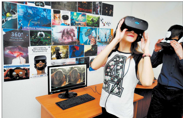
Путешествие в виртуальный мир даёт вполне конкретные эмоциональные впечатления