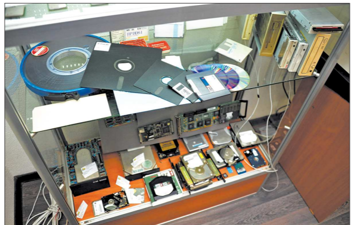
Эволюция носителей памяти: от огромной бобины с магнитной лентой — до миниатюрной флешки