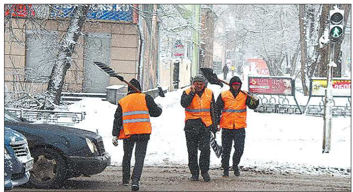
Обречённым на обязательные работы выдадут не только лопату и метлу, но и яркую жилетку, как положено для безопасности