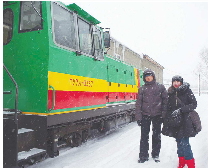
Чтобы прокатиться в маленьких вагончиках по узкоколейке, в Алапаевск порой приезжают туристы даже из других государств. Эта пара – мексиканцы, которые учатся в Уральском федеральном университете

– Нет, цена остаётся прежней и для населения очень демократичной. Сегодня проезд в плацкартном вагоне от