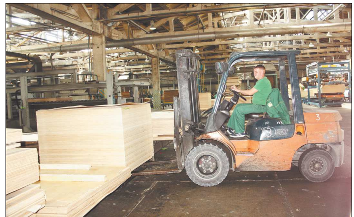
К своему юбилею – 45-летию – верхнесинячихинская «СВЕЗА» достигла рекордной отметки годового выпуска продукции – 200 тысяч кубометров

Сегодня «СВЕЗА Верхняя Синячиха» выпускает фанеру марки ФК (используется для внутренних работ), ФСФ (оптимальна для внешних работ) и ламинированную фанеру. Продукция с маркировкой из Верхней Синячихи расходуется по всему миру. Её можно встретить на разных объектах, например, фанера была использована при строительстве космодрома «Восточный» и возведении самого высокого здания Урала – башни «Исеть» в Екатеринбурге. В этом году предприятие отказалось от выпуска фанеры формата 8x5 футов в пользу более востребованного – 8x4 фута.