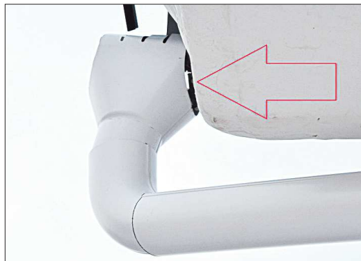
Водосточные трубы отпадают