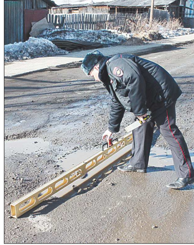
На дорогах, по которым ходят автобусы, сотрудники ГИБДД установили грубые нарушения