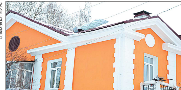
Кровля деформирована по всей площади дома