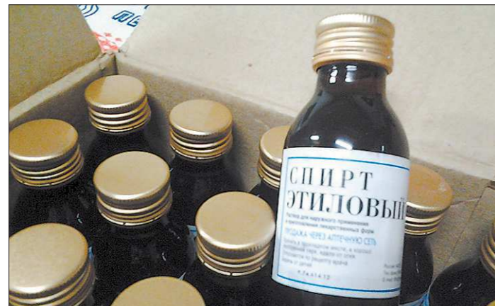
По словам читателей, алкоголь продают в таких бутылках, привозят их с подпольного завода из Нижнего Тагила. Акцизных марок нет

В деревнях Свердловской области прямо в жилых домах идёт бойкая торговля спиртным сомнительного происхождения, рассказывают «ОГ» читатели. Продавцов не смущают ни возмущение соседей, ни административные штрафы. В настоящее время Госдума рассматривает сразу два законопроекта, призванных ужесточить наказание за продажу фальсифицированных спиртосодержащих напитков. Жители законотворцев поддерживают и возлагают на них надежды.