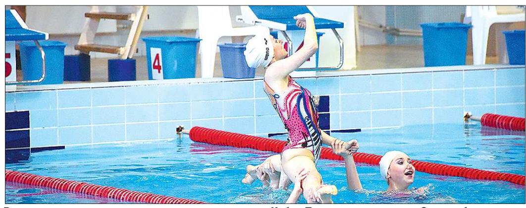
Выступление команды синхронисток на открытии Кубка Попова по плаванию. Скоро оба вида спорта будут жить под одной крышей