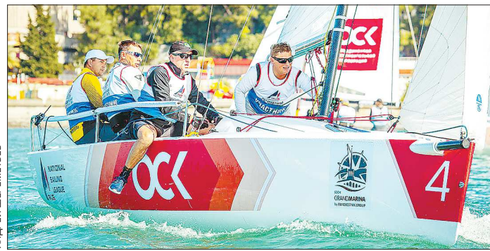
Экипаж на яхте во время регаты

«Повелитель паруса — Европа» — один из лидеров нынешнего сезона. Правда, стоило оговорить один важный момент. Вместе с кубком НПЛ команда также выиграла возможность участия в Международ-