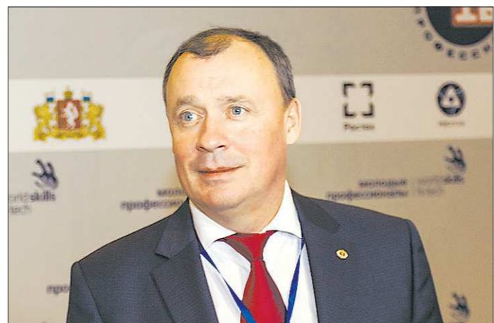
На своём нынешнем посту первый заместитель губернатора региона Алексей Орлов курирует реальный сектор экономики

Вчера, 20 марта, первый заместитель губернатора Свердловской области Алексей Орлов отметил юбилей — 50 лет.