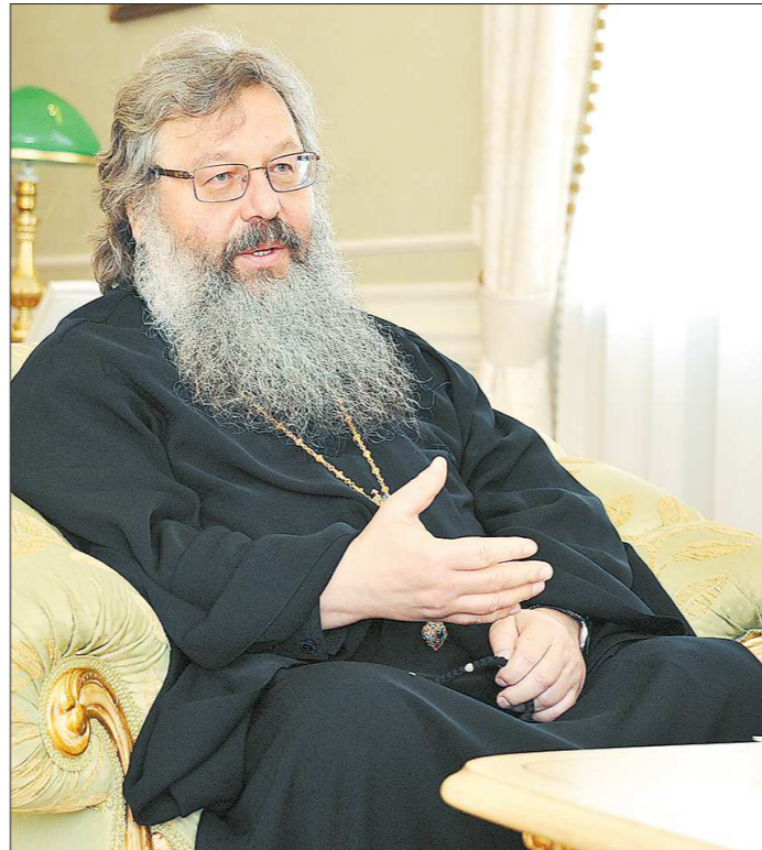
Митрополит Екатеринбургский и Верхотурский Кирилл: «Ощущение царя и державности свойственно нашему народу»

Церковь не стремится к восстановлению самодержавия, но есть люди, которые подобные идеи высказывают. Есть те, кто придерживается другой системы взглядов.