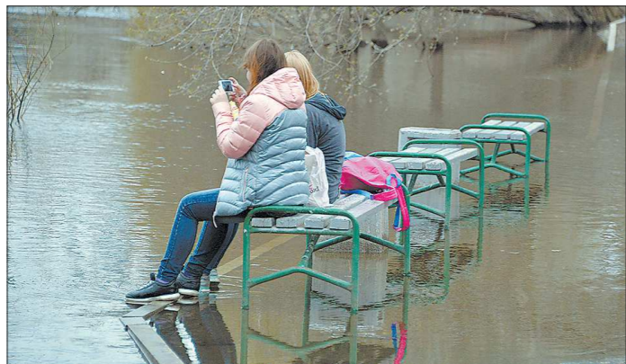
Отдельно Евгений Куйвашев поручил бороться с «весенним половодьем» на улицах городов: в уборке снега и грязи должна быть задействована вся коммунальная техника и все кадры