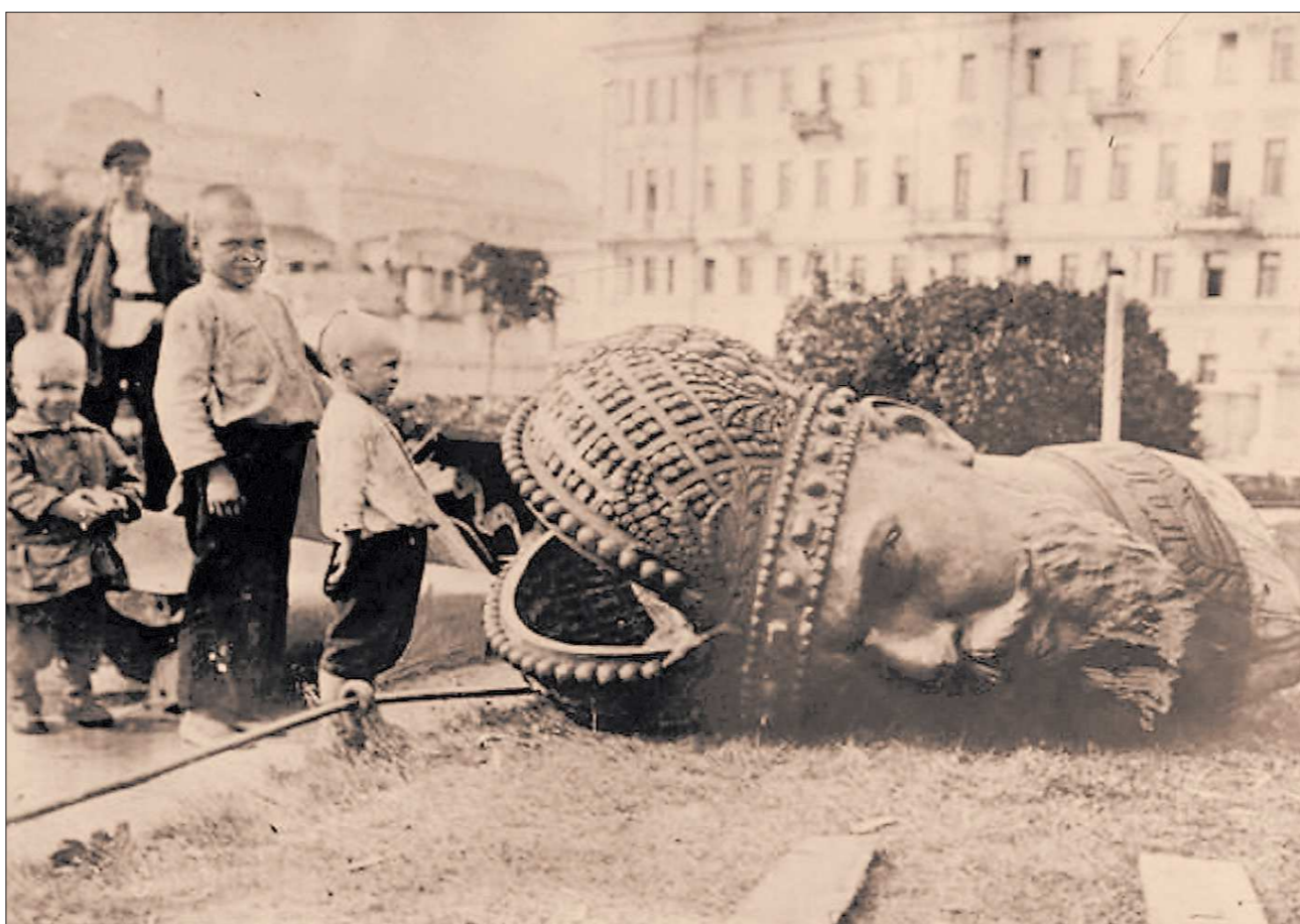
На фото лета 1918 года остатки разрушенного монумента Александру III — отцу Николаю II. Монархии уже нет, в стране война, разруха, беспризорные дети...