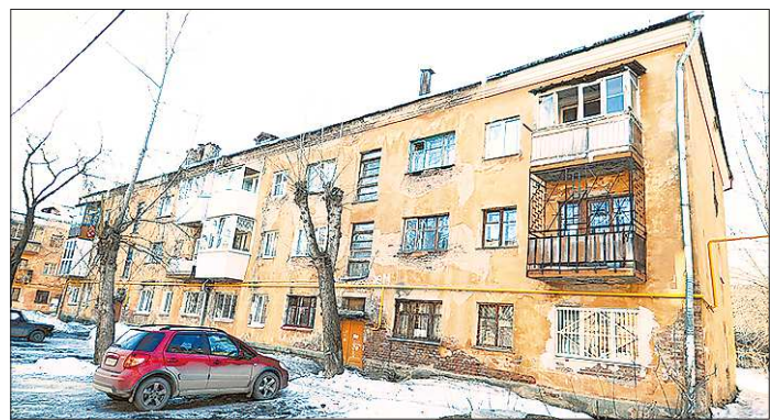
Хрущёвки — не самое страшное бедствие для Екатеринбурга. В городе до сих пор не снесены деревянные бараки, которыми не мешало бы заняться в первую очередь

При составлении стратегии учитывается уже накопленный опыт международного сотрудничества, технологические компетенции региона и прогнозы развития рынков. Для достижения цели в Свердловской области планируют создать единую структуру поддержки экспорта предприятий региона на основании существующих институтов.