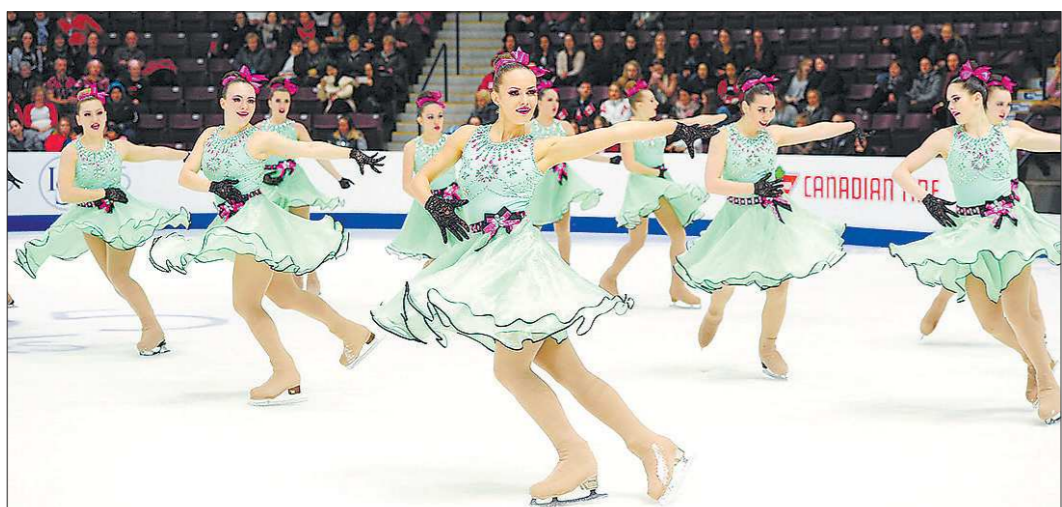
В 2013 году у синхронисток «Юности» была бронза, нынче — первое мировое золото