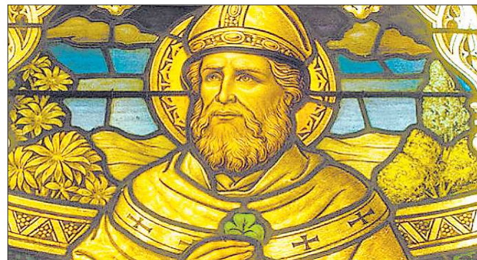
Святой Патрик обычно изображается с листком клевера — считается, когда он нес христианство ирландским язычникам, то при помощи трилистника объяснял единство Святой Троицы. Православные в России будут его чтить 30 марта (католики отмечают 17 марта)