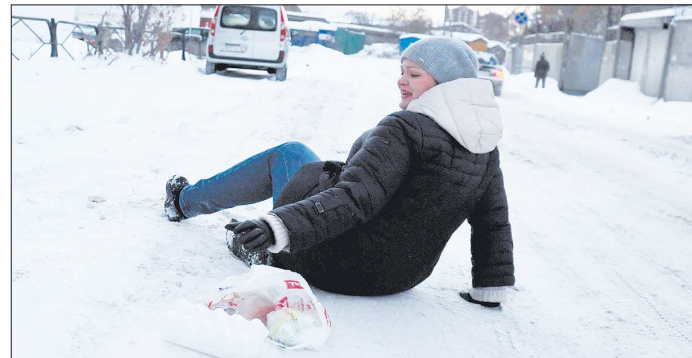
Тот, кто не почистил дорогу, отдаст деньги даже за разбитые на льду покупки

Далее необходимо определиться с ответчиком: если травма получена, к примеру, на тротуаре, ответчиком должна стать администрация города. За уборку крыльца магазина и прилегающей территории отвечает администрация магазина. А если это крыльцо подъезда многоквартирного дома или придомовая территория — ответственность на УК или ТСЖ. Если истина о принадлежности территории нет, ответ на этот вопрос можно получить в администрации района. В суд истец должен представить доказательства факта падения, степени вины ответчика, а также обосновать искивые требования. Доказательствами могут стать: