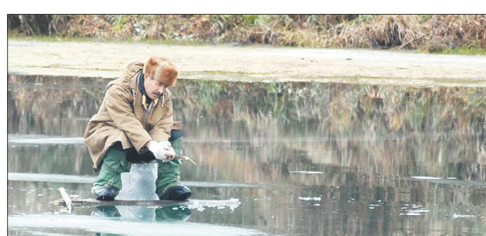
Спасатели предлагают штрафовать рыбаков, которые выходят на опасный лёд

ному устройству и вопросам местного самоуправления. Она – одна из немногих женщин в России, имеющих звание генерал-майора. А британская ежегодная Ассамблея женщин присвоила ей титул «Величайшая женщина XX столетия».