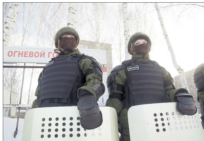
Служить в женском спецназе ГУФСИН разрешено до 40 лет