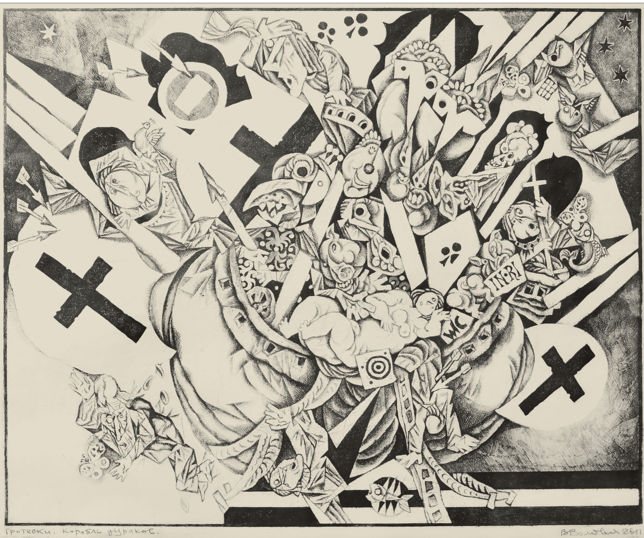
Гротески. Корабль дураков.