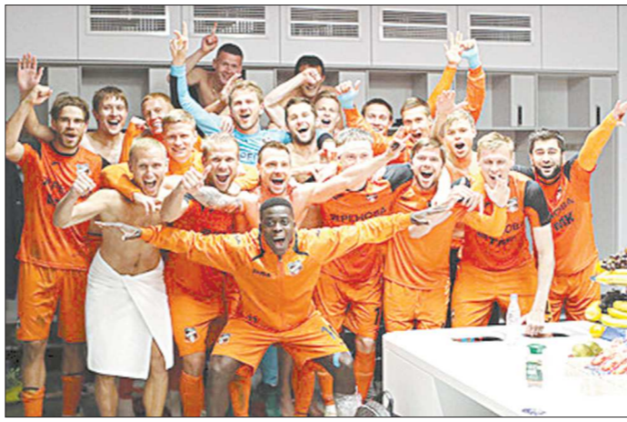
Победное фото «Урала» из раздевалки

Футбольный клуб «Урал» совершил настоящий спортивный подвиг: в четвертьфинале Кубка России, уступая по ходу встречи со счетом 0:3, «шмели» сумели перевести игру в дополнительное время, а затем в серии пенальти добиться себе путёвку в полуфинал второго по значимости турнира России. Последний раз в полуфинале Кубка России «Урал» играл в далёком 2008-м, а с такого счёта в новейшей истории и вовсе никогда не обыгрывался.