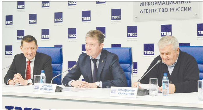
Несмотря на неутешительные результаты «Автомобилиста» в нынешнем сезоне, руководство клуба полно оптимизма