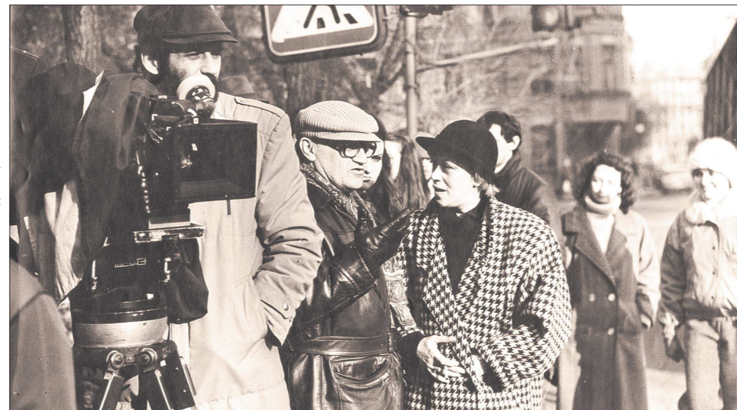
Фото со съёмки картины «Будни и праздники Серафимы Глюкиной» (1988) Свердловской киностудии. В главной роли – Алина Фрейндлих (на фото)