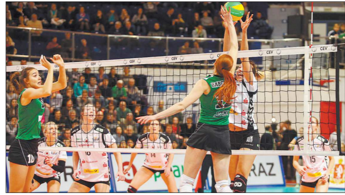
«Уралочка» сыграла в Дрездене молодёжным составом