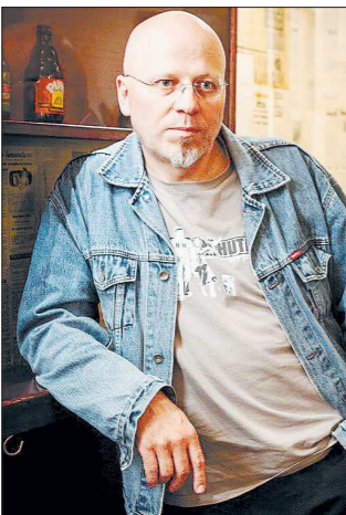
Яцек Матеcki стал своим на Урале

В Польше вышла в свет книга «Драма номер три», посвящённая одноимённому театру из Каменска-Уральского. Автор книги — известный польский писатель Яцек МАТЕЦКИ, приезжавший на Урал несколько раз в 2016 году и проживший здесь в общей сложности около 2 месяцев.