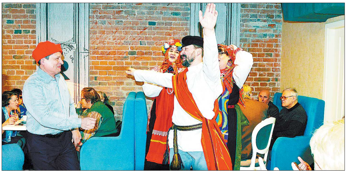
Ассоциация народов Урала угостила ветеранов журналистики блинами и порадовала задорным концертом