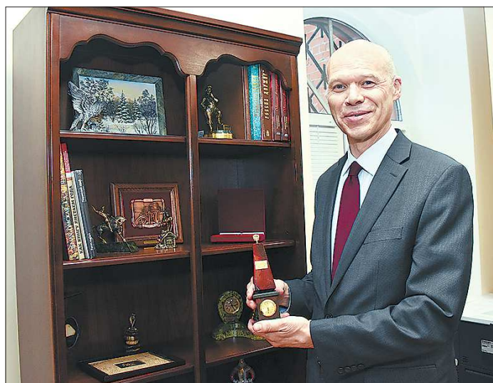
Генконсул демонстрирует стеллаж с уральскими подарками. Говорит, когда уедет, оставит презенты своему сменщику

— Вы сами голосовали? — Да, и этим правом могу воспользоваться любой американец независимо от того, где он проживает. Здесь, в генеральном консульстве, да и в посольствах США всех стран мира, мы помогаем нашим согражданам проголосовать. — Если не секрет, кого поддержали? — В демократической стране, помимо права голосовать, у нас также есть право на конфиденциальность выбора. А если серьёзно, не так важно, за кого я проголосовал, так или иначе будем претворять ту политику, которую выбирает вновь избранный президент.