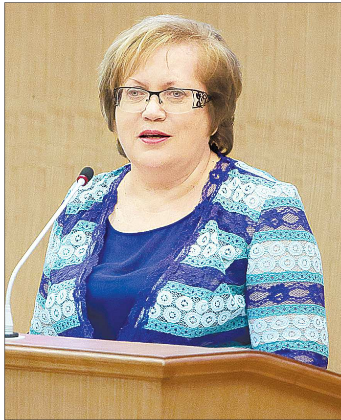
Уполномоченный по правам человека в Свердловской области Татьяна Мерзлякова

Количество жалоб на нарушение политических прав осталось традиционно невысоким, составив около 0,8 % от общего количества поступивших жалоб, что незначительно превышает показатель предыдущего года.