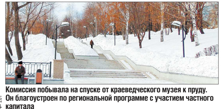
Комиссия побывала на спуске от краеведческого музея к пруду. Он благоустроен по региональной программе с участием частного капитала