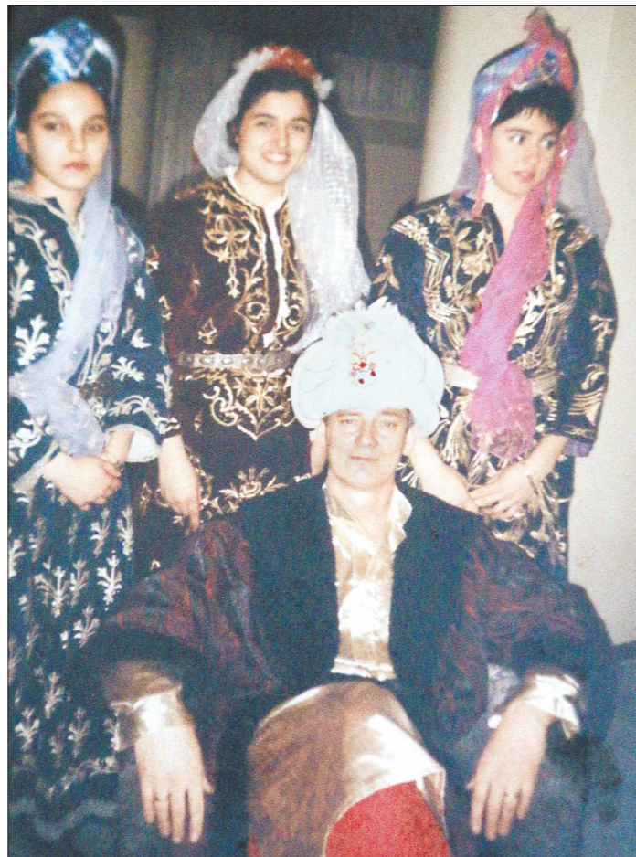
В турецких газетах эта фотография публиковалась с подписью «Новый султан турецкого волейбола»