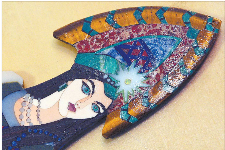
В работе художник обыгрывает естественный природный рисунок камней: на все тени и блики в глазах Хозяйки Медной горы ушло почти 30 крошечных деталей