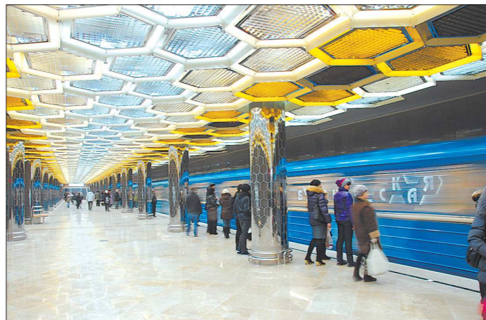
По объёму перевезённых пассажиров уральская подземка занимает четвёртое место, уступая только Московскому, Санкт-Петербургскому и Новосибирскому метрополитенам

Напомним, что в советские годы метрополитен относился к сфере правового регулирования железнодорожного транспорта. После 90-х годов этот вид транспорта стал субъектом. На сегодняшний день в регионах, где есть метрополитен, существуют только местные законодательные акты, а в некоторых их вовсе нет. Ещё недавно шли споры, есть ли особенности правового регулирования метрополитена, но в конце концов, транспортники и законодатели пришли к единому мнению, что этот вид транспорта имеет