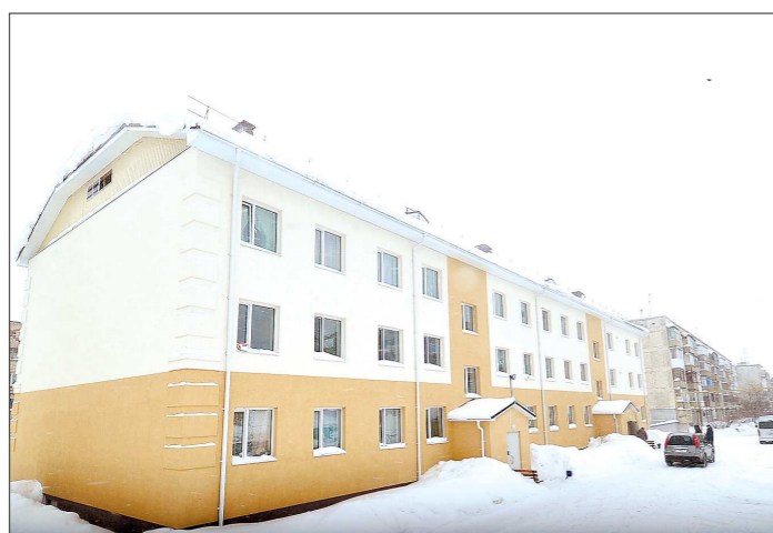
Дом по Ухтомского, 32 сдали прошлым летом. Ключи от квартир получили 38 семей

Один за другим муниципалитеты закрывают программу по переселению из аварийного жилищного фонда, признанного таковым до января 2012 года, которая заканчивается в сентябре 2017 года, и готовятся приступить к следующему этапу — переселению. Параллельно администрация готовится капитально отремонтировать следующую партию многоквартирных домов. За это время муниципалитеты изучили возможности — свои и подрядчиков — и готовы делиться опытом с другими округами. О том, как конструктивно использовать этот опыт, шла речь на совещании с участием губернатора, членов правительства и руководства муниципалитета, проведенном в ходе рабочей поездки главы региона в городской округ Красноуральск.