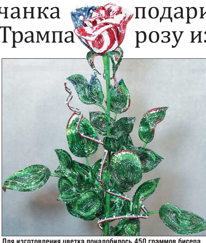
Для изготовления цветка понадобилось 450 граммов бисера