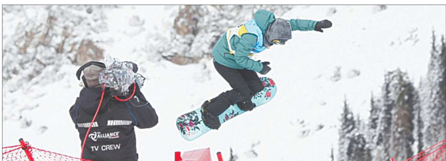
Соревнования сноубордистов вызывают у зрителей особый интерес: от сложнейших прыжков спортсменов захватывает дух

— Особенно обсуждается всеми ситуация с Логиновым и Фуркадом. — Да, но ничего необычного. С немцами были похожие ситуации. В 2008–2009 годах Антона вообще с лыжни выталкивали. На мой взгляд, это просто бессовестные люди. Борьба должна быть честной. А пока мы от честности очень далеки. — Личь бы на результате Антона эта атмосфера враждебности не отразилась... — Наоборот, он будет сильнее. Это придаст ему сил для борьбы. У него получится – я в этом уверен.