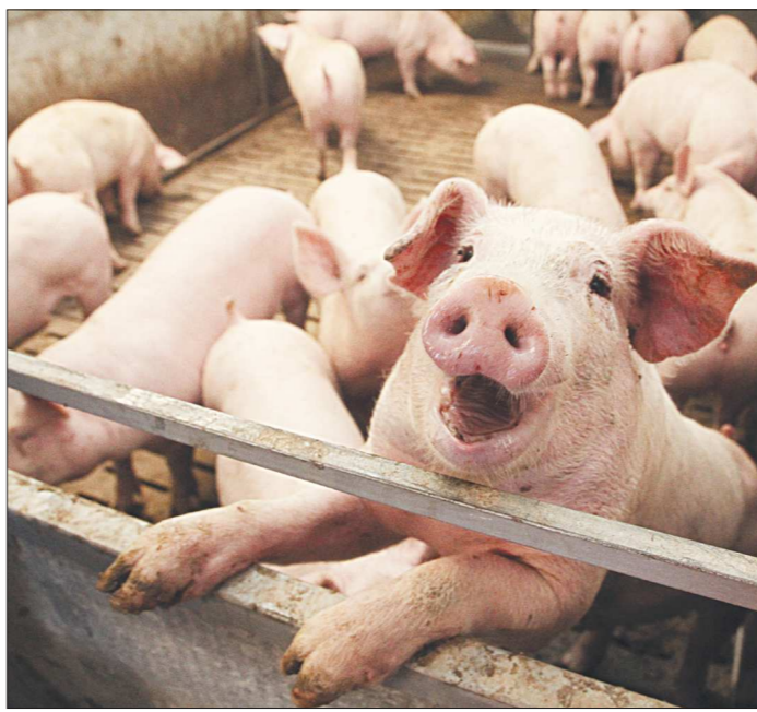
Свиноводческий комплекс входит в четвёрку лидеров производителей свинины в Свердловской области

Сокращение поставок импортного мяса в нашу страну не могло не сказаться положительно на работе отечественных производителей. По данным маркетинговых исследований, свинина в России сегодня занимает одно из ведущих, после мяса птицы, мест по выработке и потреблению. Эта востребованность неизбежно приводит к конкуренции среди производителей. Такая же ситуация и на Урале. Чтобы познакомиться с ситуацией изнутри, мы побывали в ЗАО «Талицкое» – единственном предприятии, занимающемся производством свинины на территории округа.