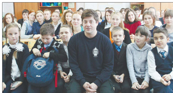
После беседы школьники устроили фотосессию с актёром