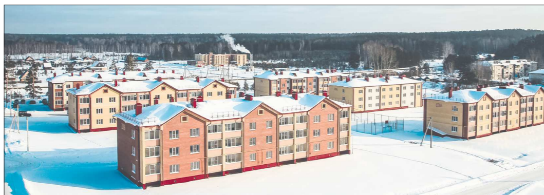
Вот такой вид открывается, если посмотреть на часть микрорайона с высоты птичьего полёта. Для такого эксклюзивного кадра мы воспользовались краном-манипулятором, чтобы подняться и увидеть, как красив новый район