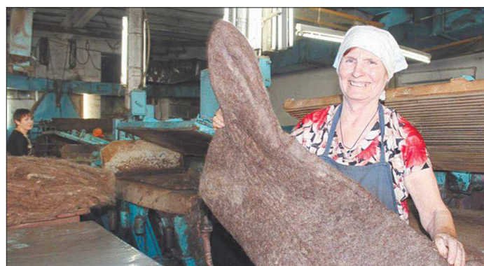
На фабрике работают около 100 человек