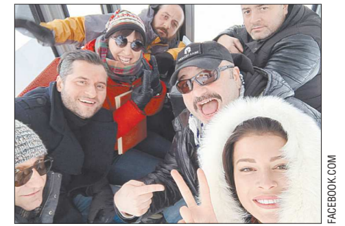
Съёмки проходят в непростых условиях – в горах Грузии. Но София (на переднем плане) делится фотографиями в соцсетях, рассказывая, в какую гостеприимную атмосферу попал

Мисс Россия – 2015 и вице-мисс мира – 2015 екатеринбурженка София Никитчук снялась в клипе на песню «Снег» Ираклия Пирцхалавы . По сюжету София играет возлюбленную певца.