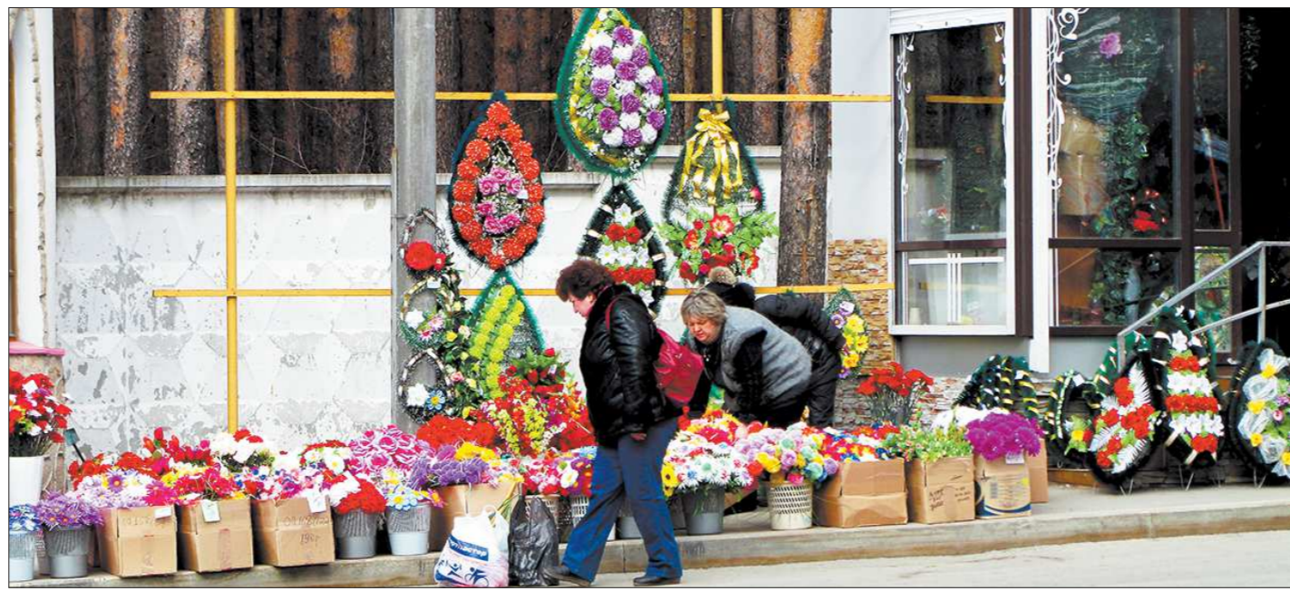
Что нужно улучшить в системе работы кладбищ, прописали в новой концепции, которая опубликована на сайте города