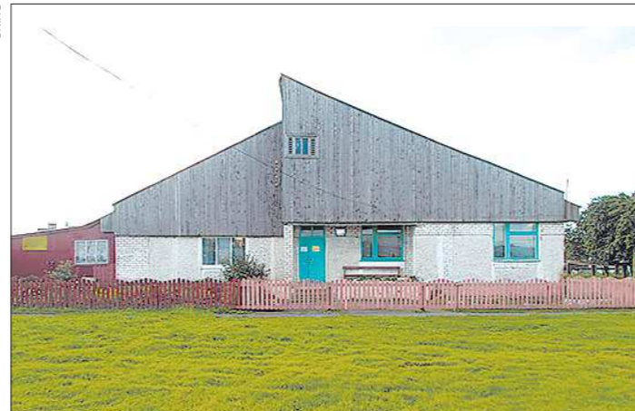
Осинцевский ФАП в месяц принимает до 200 человек