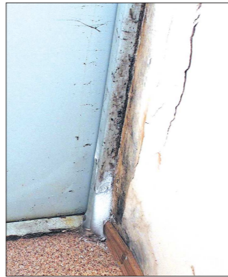
В Рекаловском ФАПе спустя полтора года после ремонта появилась плесень