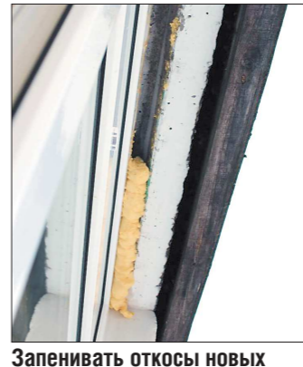
Запенивать откосы новых пластиковых окон жителям Осинцевского пришлось самостоятельно