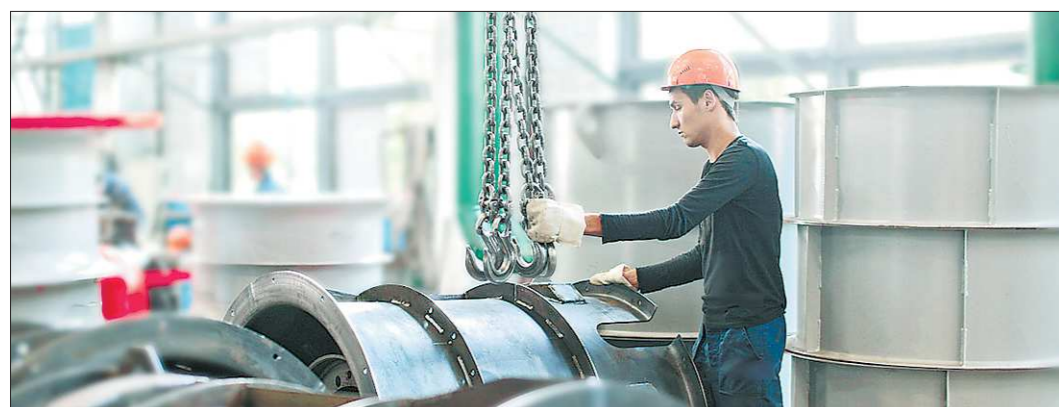
На заводе чиновникам, в частности, показали новый осевой вентилятор для тоннелей «Проект VP», который по многим техническим параметрам превосходит зарубежные аналоги