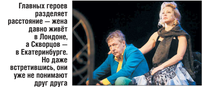
Главных героев разделяет расстояние — жена давно живёт в Лондоне, а Скворцов — в Екатеринбурге. Но даже встретившись, они уже не понимают друг друга