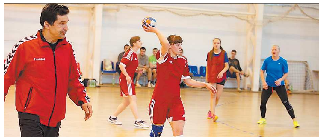
«Свердловчанка» примет в Екатеринбурге третий тур чемпионата России с 7 по 11 февраля

В общем, шведы действительно очень сильны. У них действительно чемпионский уровень игры. Наши хоккеисты, скажем прямо, пока его не показали — про отсутствие командной игры в атаке я уже говорил, не на должном уровне и наша защита. Но я всё-таки надеюсь, что до финала тренерскому штабу нашей сборной вполне по силам провести работу над ошибками. Правда, «репетируются» уже практически не будет возможности — матч с Венгрозией, да и с Финляндией тоже, — не те, где можно отработать игру со шведами.