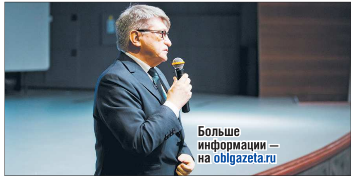
Больше информации — на oblgazeta.ru