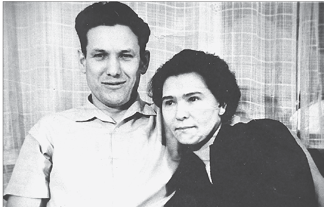
Борис Николаевич и Наина Иосифовна, 1954 год

— Приезжаешь в командировку со служебным удостоверением, там написано «Анастасия», а коллеги зовут Наиной, сразу начинаются вопросы. Или входит главный инженер института в комнату, — а я работала в «Союзводоканале», — и обращается ко мне «Анастасия Иосифовна», а я не реагирую. Мне это надоело, и как-то по пути домой зашла в ЗАГС... В общем, дело оказалось несложным. Написала заявление и принесла документы. Борис был в командировке. Только когда получила новый паспорт, показала его ему. Он никак не отреагировал, улыбулся и не сказал ни слова. Просто потом довольно долго обращался ко мне «девушка», не называя ни Наю, ни Наина. Если бы он тогда попросил вернуть имя «Анастасия», я бы