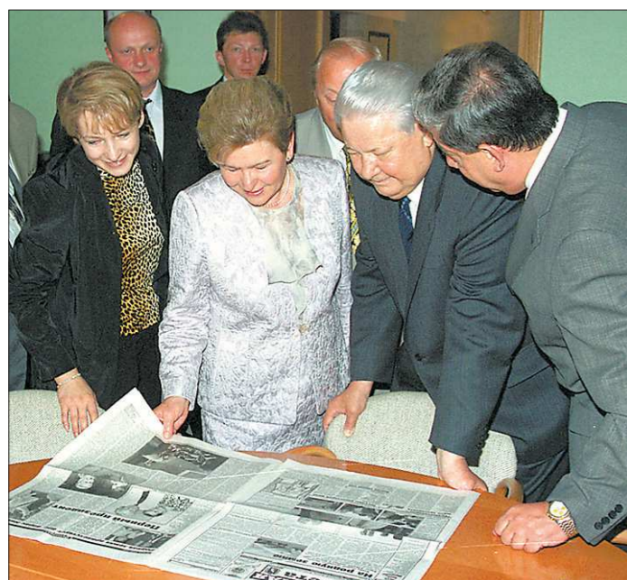
Борис Ельцин, его супруга Наина и их дочь Татьяна знакомятся с номером «Областной газеты», рассказывающим о работе Ельцина на Среднем Урале (Екатеринбург, 29 июня 2000 года)

Точка зрения автора может не совпадать с мнением редакции