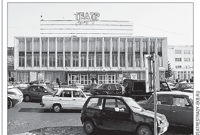
Зрительный зал Уральского государственного театра эстрады вмещает 650 человек. По своему техническому оснащению это один из совершенных зрительных залов Свердловской области