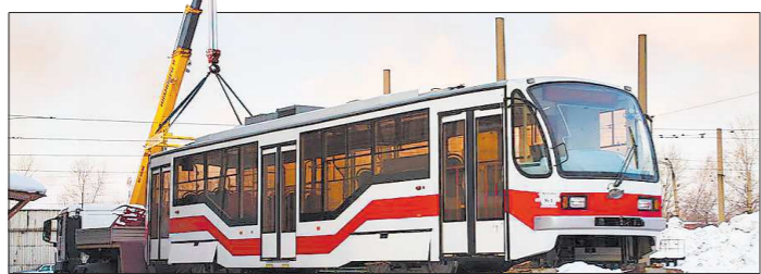
Первые трамваи уже поступили в Нижний Тагил

В ближайшие два года трамвайное сообщение в Нижнем Тагиле, как и в Екатеринбурге, ждёт реформа. Для этого закупят 30 низкопольных вагонов, построят новые линии и остановочные пункты в строящихся микрорайонах, увеличат количество рейсов. Новую схему работы электротранспорта вынесли на обсуждение горожан.