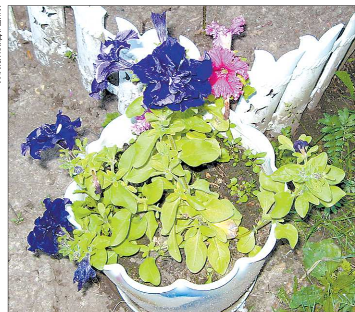
Цветы, посаженные за три месяца до высадки в открытый грунт, успевают хорошо развиться и зацвести

— Затем закрываем ящик плёнкой или стеклом и ста-