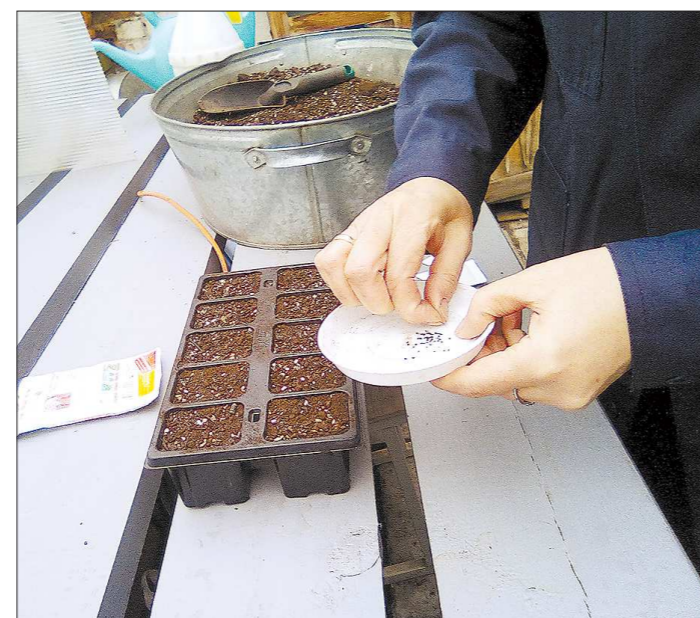
Обычно семена петрушки продают в гранулах, это увеличивает их размер и позволяет сеять на расстоянии друг от друга