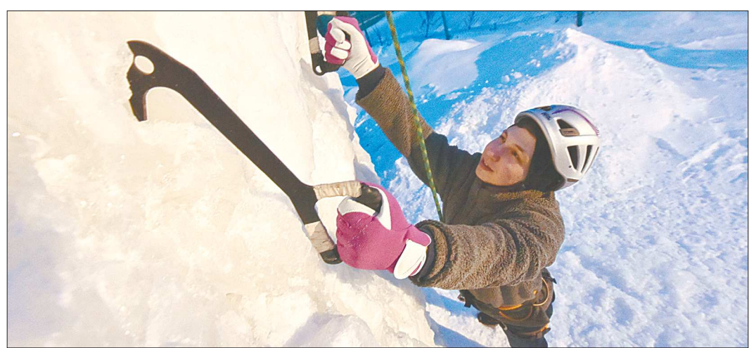
Журналист «ОГ» попробовал свои силы в экзотическом виде спорта – ледолазании, в котором от человека требуется хорошая физическая подготовка

Любимый маршрут? Как многодневка, конечно – Маньпупунёр. Знаковый, сложный и захватывающий маршрут – однозначно. Прекрасный в любое время года. Некогда он был труднодоступным, сегодня проще – везде пробиты пути. Но погодные условия Северного Урала всегда будут подкидывать сюрпризы в виде пурги или дождя, неверно выбранная река, взорванные геологоразведочными машинами дорог... А лыжное восхождение для человека, который за рулём чувствует себя намного увереннее, чем на своих двоих – это тоже экстрим.