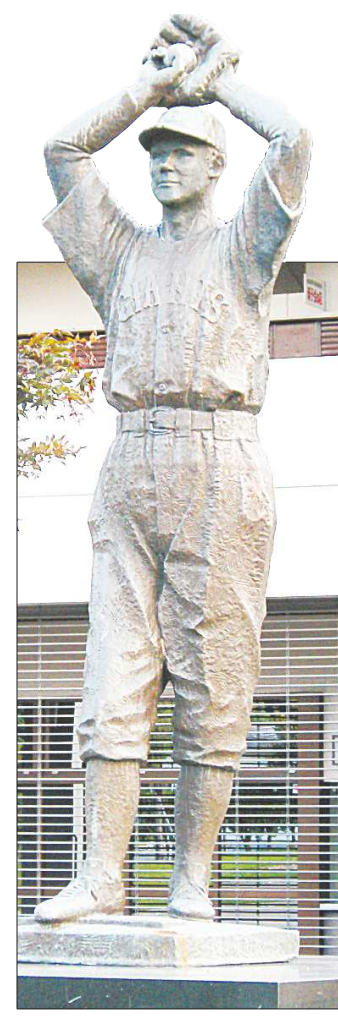
В 1983 году в Асахиаве новый 25-тысячный бейсбольный стадион получил имя Старфин. Перед входом на арену установлена бронзовая статуя спортсмена