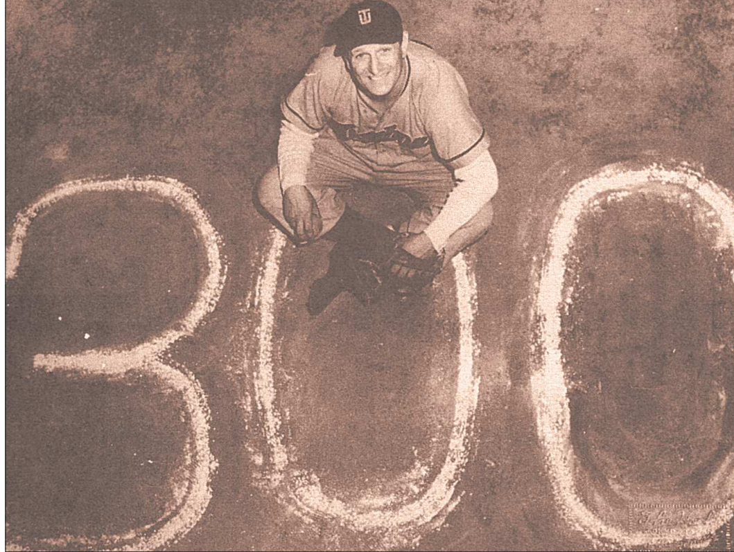
У Виктора Старухина-Старфина было несколько имён-прозвищ. Например, «голубоглазый японец» (среди коренных жителей этой страны голубоглазых нет). А ещё, слегка меняя подлинное имя, его звали Виктор Старфин, то есть Победа Старфин: в 1955 году он стал первым питчером Японской бейсбольной лиги, который добрался до отметки 300 выигранных матчей

Дорога в Китай, куда отправились Старухины, получилась крайне опасной. Однажды им пришлось ехать в одном вагоне с большими тифом, а в другой раз - прятаться в повозке с трупами... Но семья всё-таки добралась до Харбина. Там уральцы надеялись переждать революционную смуту, а потом вернуться на родину. Но эти надежды не сбылись: и советская власть падать не собиралась, и жизнь в Китае не складывалась... После десятилетия неустроенности Старухины в 1929 году решились на ещё один переезд - в Японию, на остров Хоккайдо.