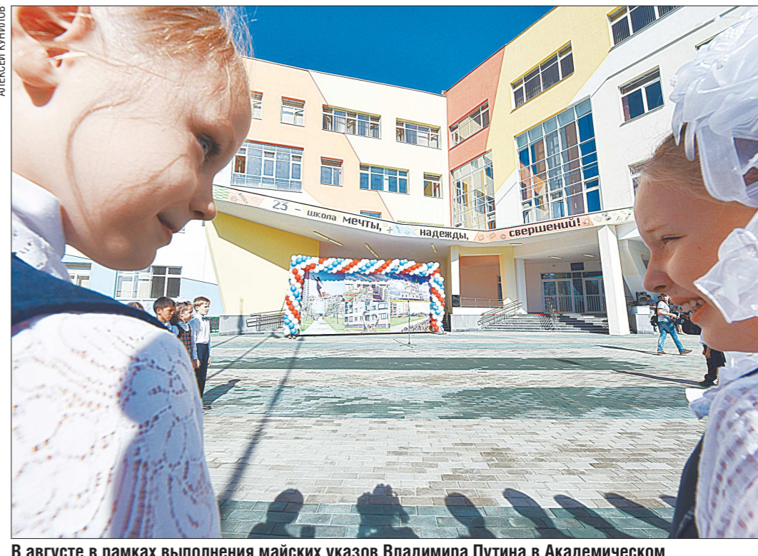
В августе в рамках выполнения майских указов Владимира Путина в Академическом районе Екатеринбурга открылась первая очередь школы № 23. Это первый объект в рамках федеральной целевой программы по строительству новых школ и одно из самых больших и современных общеобразовательных учреждений в России. Школа приняла первую тысячу учеников, ещё 875 примет вторая очередь школы, которая сейчас строится

Вчера я встречался с Президентом России Владимиром Владимировичем Путиным. Мы обсудили важнейшие вопросы социально-экономического развития региона. Я ещё раз убедился, какое большое значение Президент придаёт Уралу, укреплению его потенциала в развитии страны.