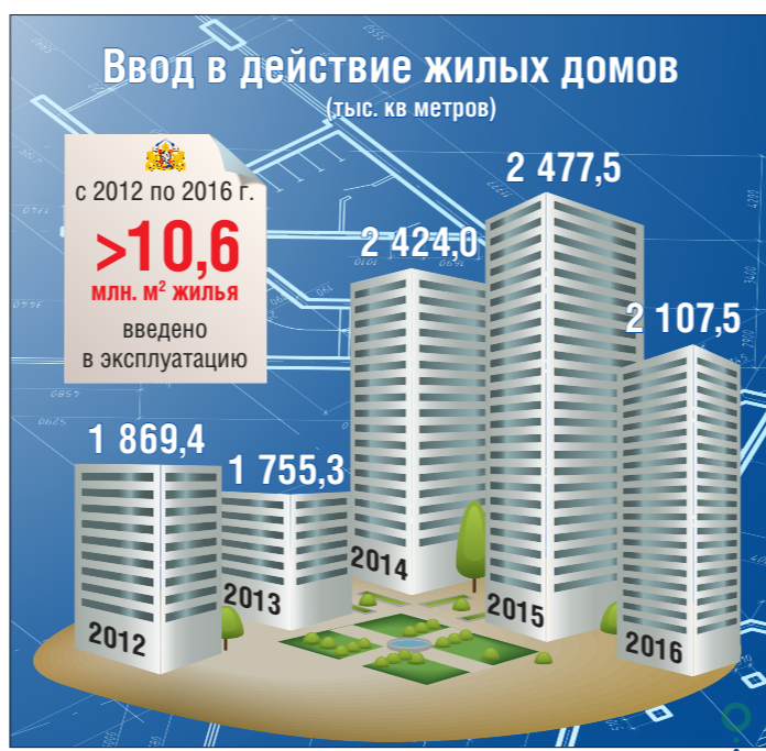
Третий год подряд Средний Урал бьёт советский рекорд по строительству жилья. По итогам прошлого года в регионе вновь ввели более двух миллионов жилых квадратных метров