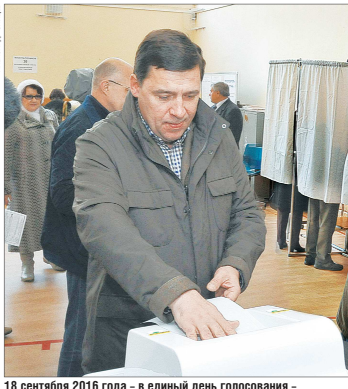
18 сентября 2016 года – в единый день голосования – в Свердловской области прошли выборы в региональное Заксобрание. «Единая Россия», список которой возглавлял губернатор Евгений Куйвашев, получила в областном парламенте 36 депутатских мандатов из 50