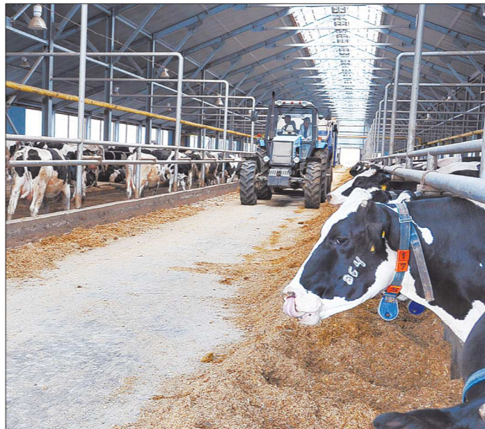
С 2009 года в Свердловской области непрерывно растёт производство молока. Реализация молока – главная статья дохода наших аграриев. По валовому его производству, а также по молочной продуктивности коров Свердловская область входит в десятку лучших субъектов Российской Федерации. В регионе постоянно строятся новые и реконструируются старые фермы. В 2016 году построены или модернизированы 21 объект молочного животноводства на 3800 ското-мест. Благодаря этой работе почти треть коров в крупных хозяйствах региона содержится в новых или отремонтированных корпусах, где внедрены самые передовые технологии

Для этого у нас есть все необходимые возможности. Судите сами. Минерально-сырьевая база Свердловской области обеспечивает значительную часть добычи в России ванадия, бокситов, хризотил-асбеста, железных руд, огнеупорных глин. Значительные запасы никелевых руд, драгоценных металлов, горнохимического сырья, неруд-