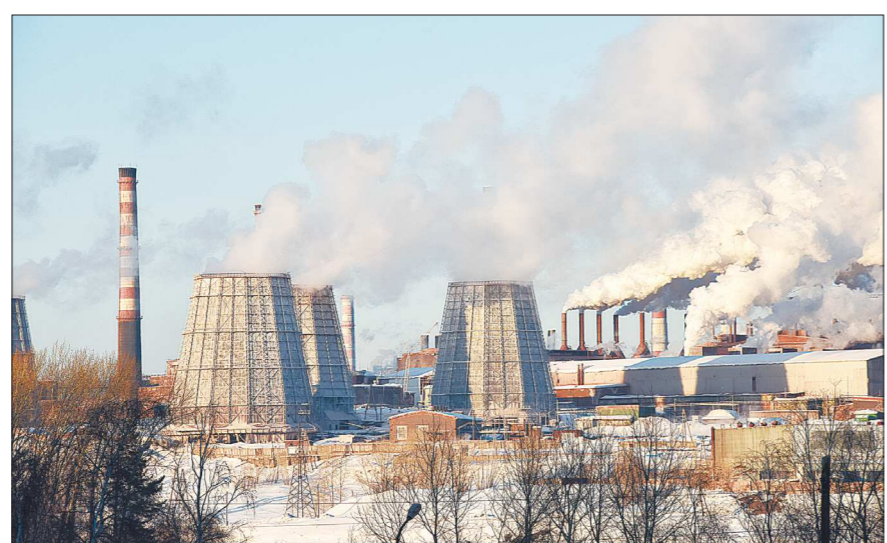
19 сентября 2016 года Красноуральск первым среди свердловских моногородов получил статус территории опережающего социально-экономического развития (ТОР). В городе создадут более двух тысяч рабочих мест, не связанных с градообразующим предприятием (Богословский алюминиевый заводом – на фото), а резидентам, которые зайдут на территорию ТОР, будут предоставлены налоговые преференции

Нас не устраивает положение Урала в десятке российских лидеров. Пора возвращаться в тройку лидеров России – Москва, Санкт-Петербург, Свердловская область