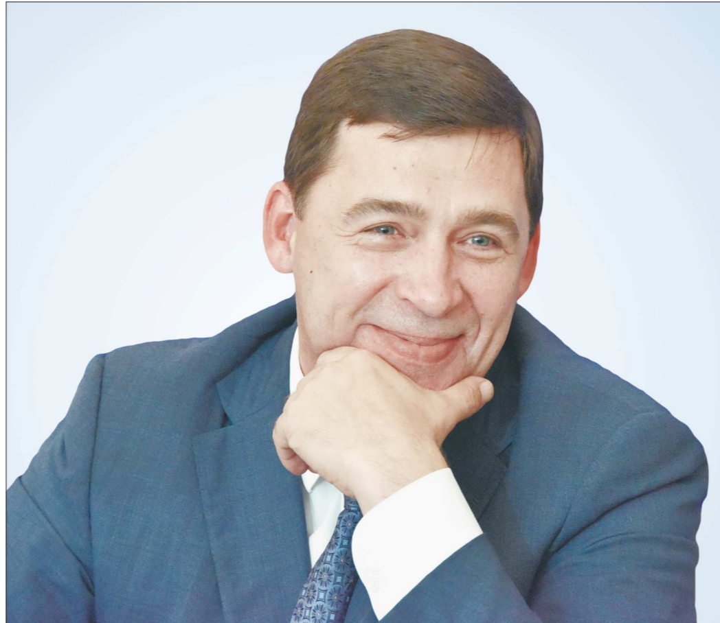
По поручению губернатора Свердловской области Евгения Куйвашева сейчас разрабатывается программа «Пятилетка развития». Весной она будет вынесена на всенародное обсуждение

Сегодня меня не покидает ощущение, что мы переживаем переломный момент. Это время, когда область находится на перепутье, когда появляются реальные альтернативы траекторий развития. И нам нельзя ошибиться в выборе верной дороги