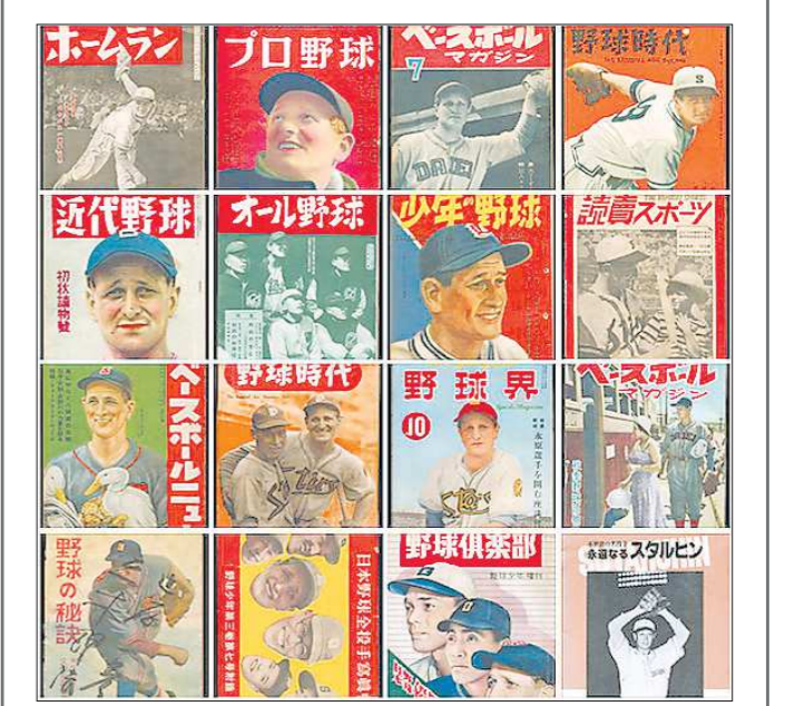
В годы расцвета своей карьеры Виктор Старухин появлялся на обложках японских журналов чаще, чем самые популярные певцы и кинозвёзды