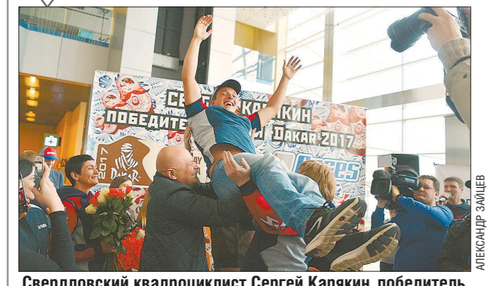
Свердловский квадроциклст Сергей Карякин, победитель ралли «Дакар», вернулся в родной Екатеринбург. «ОГ» встретила его в аэропорту