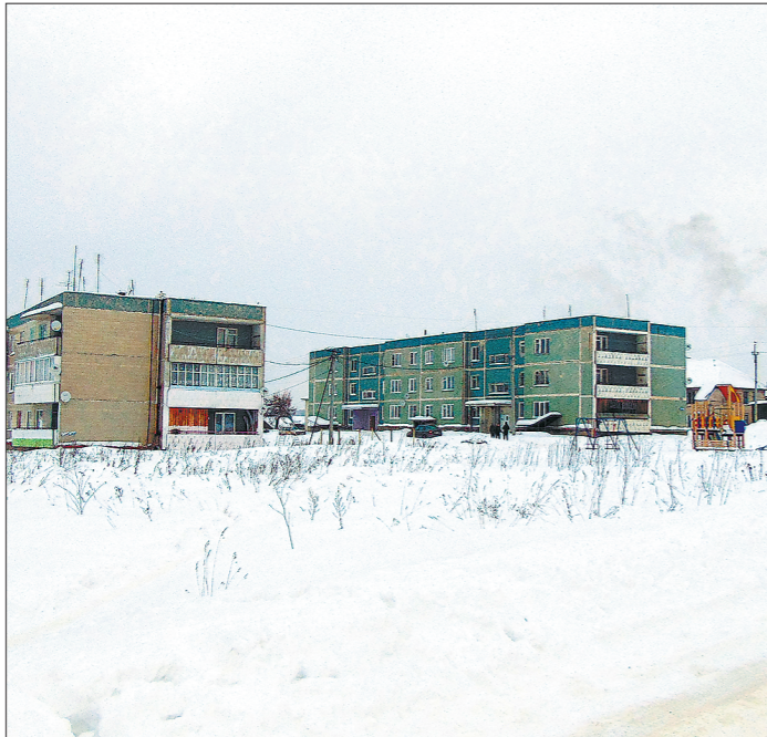
Из 660 жителей Конёво в многоквартирных домах зарегистрированы 153 человека, а по факту живут 123, остальные оставили квартиры безхозными

Каково это — ходить по дому в валенках — знает каждый из 153 жителей села Конёво, прописанных в многоквартирных домах. До 2016 года старенькая угольная котельная (на местном диалекте «котельня») не справлялась с отоплением четырёх жилых домов, школы, садика, клуба и пожарного депо. Что-нибудь да приключилось с ней — то котлы выйдут из строя, то некачественный уголь подвезут, то коче-