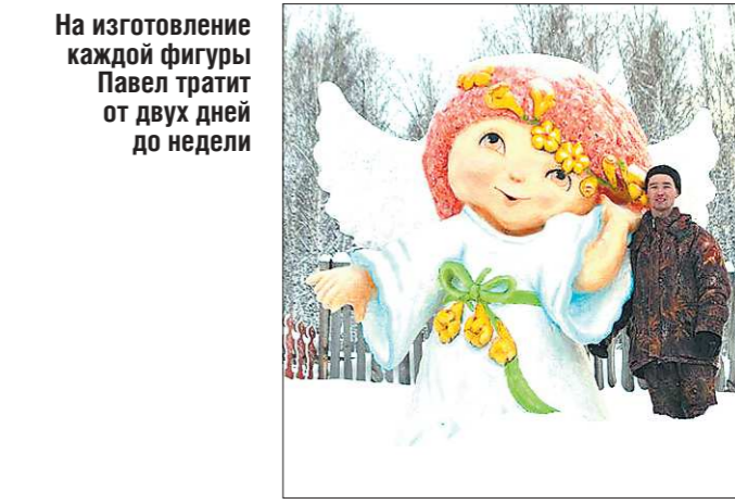
На изготовление каждой фигуры Павел тратит от двух дней до недели

Житель Артея Павел Рябчин четвёртый год подряд мастерит для сельчан трёхметровые снежные фигуры, сообщает «Артинские вести». Посмотреть на местную достопримечательность и покатаются на 50-метровой горке приезжают даже из соседних деревень и городов.