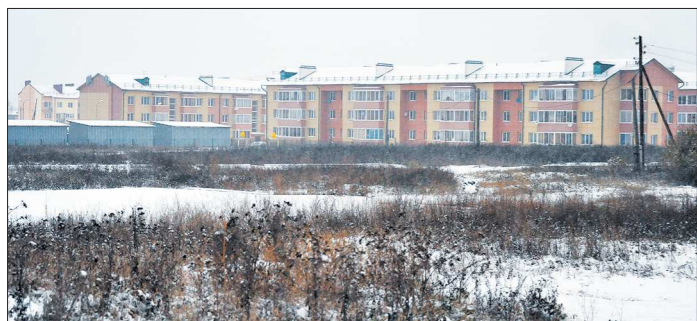
По словам главы Алапаевска, взамен 51 снесенного барака было построено 8 новых домов, переселено 889 человек