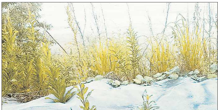
Через четыре года трава будет не пробиваться сквозь золу, а расти на плодородной почве

В этом году стартует программа по рекультивации золоотвала №2 Верхнетагильской ГРЭС. После того как станция перешла на природный газ, хранилище угольных отходов не используется для производственных нужд, но всё ещё время от времени досаждают жителям пылью. Закрывать терриконы золой плодородным слоем планируют за четыре года.