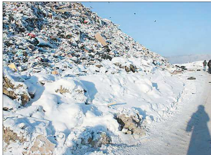
В планах верхнепышминской администрации — прекратить использование полигона в посёлке Красный и начать возить отходы на полигон Северный

Вот уже год в посёлке Красный ГО Верхняя Пышма дымит полигон твёрдых бытовых отходов. Из-за того, что арендатор полигона — компания «Благо-С» должным образом его не обрабатывает, местные жители постоянно задаются, сообщили они «ОГ». В четверг прошло уже четвёртое заседание комиссии по чрезвычайным ситуациям, на которое по обращению жителей приехали представители Общероссийского народного фронта.