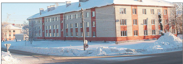
За последние три года улица Энгельса в Шале изменилась до неузнаваемости. Так, вместо целого квартала деревянных барачков теперь три многоквартирных дома. Правда, помимо радости новосёлам, новостройки ещё и добавили забот коммунальщикам: им придётся модернизировать систему отопления

Реализация программы переселения из ветхого и аварийного жилья не только способствует решению жилищных проблем местных жителей, но и меняет облик населённых пунктов. Однако за видимым результатом скрывается проблема, которая наиболее актуальна в морозы - это отопление и расход угля.