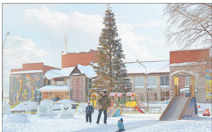
Ледовый городок на центральной площади Шали - любимое место местной детворы. Да и взрослых сюда силой тянуть не надо. Идут с охотой. А фото и селфи на ледовом троне и у петуха набрали у шалинцев больше всего лайков в социальных сетях