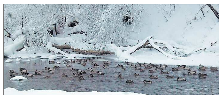
Тагильские утки в морозы «переезжают» с одного места на другое