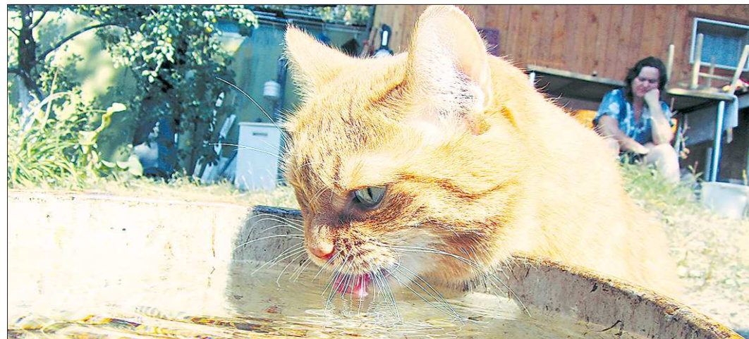
Для здоровья почек кошки должны потреблять больше в 2-3 раза воды, чем сухого корма