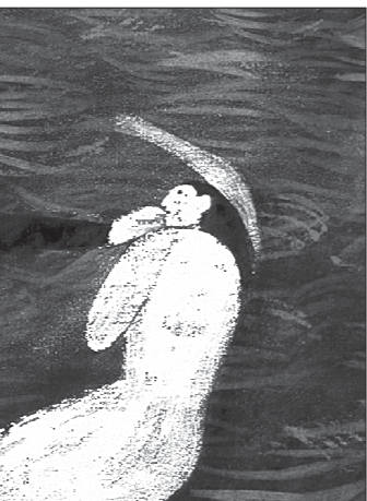
КАДР ИЗ ФИЛЬМА «СРЕДИ ЧЕРНЫХ ВОЛН». РЕЖ. АННА БУДАНОВА

— Думаю, ещё больше, чем техника, важна идея. С «Обидой» было так: я ещё училась